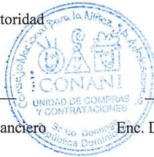
Daysi García Enc. Dpto. de Planificación y Desarrollo