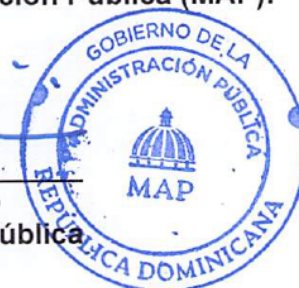
Lic. Dario Castillo Lugo Ministro de Administración Pública

Refrendada por el Ministerio de Administración Pública (MAP):